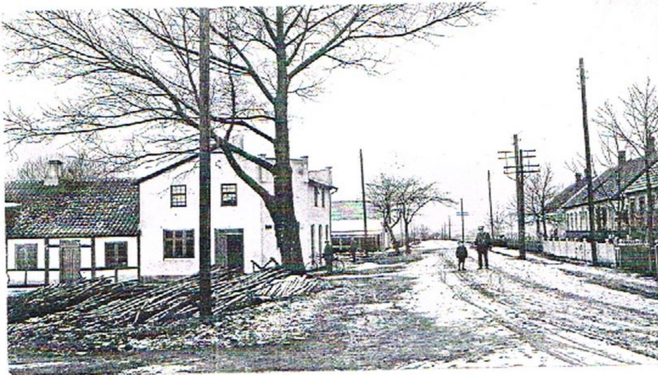
Vesterbro i 30-erne med skæreriets langs venstre vejside og vores nyerhvervede villa længst borte til højreside.